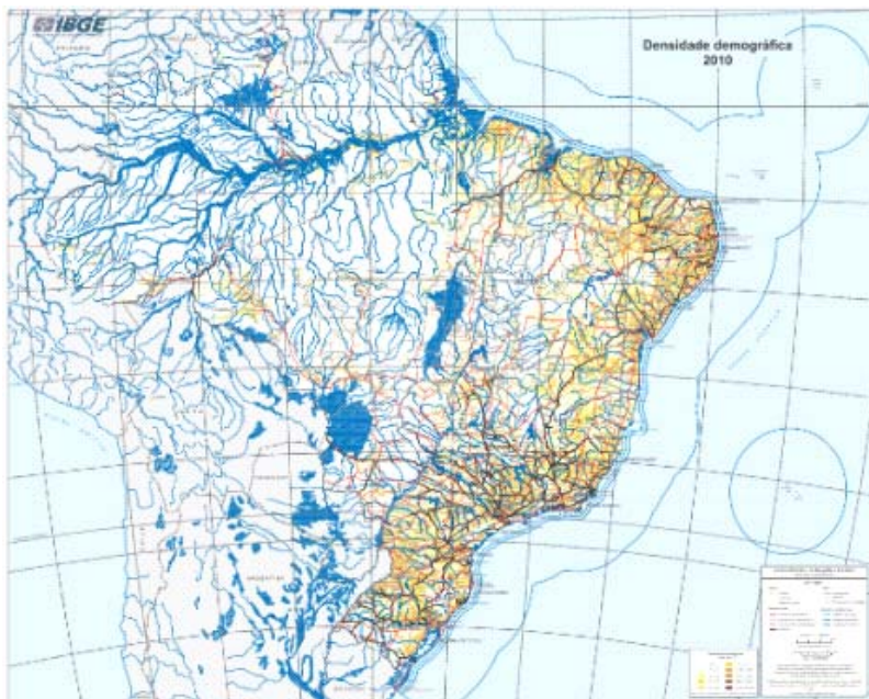
Figura 1 - Mapa Brasileiro do IBGE que retrata a distribuição espacial dos habitantes por quilômetro quadrado, além dos principais sistemas de transporte