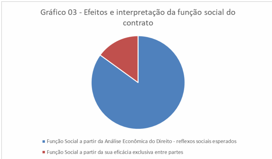
Gráfico 3 – Efeitos da interpretação da função social do contrato